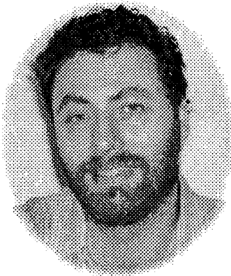
លី ពេន រុត