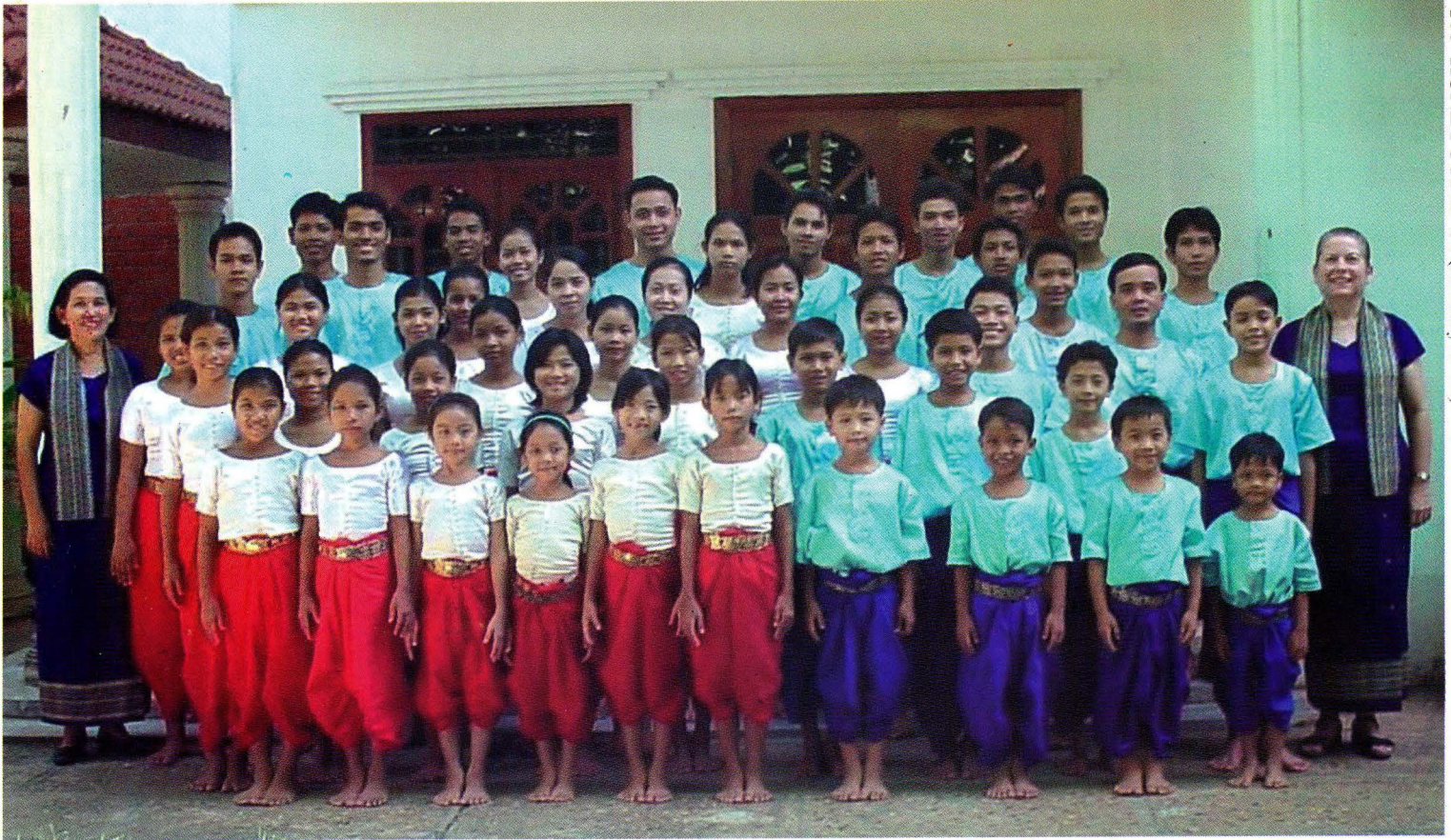
Cambodian Christian Arts Ministry School