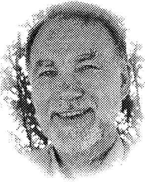
ប្រាហាម ឈីមស៍