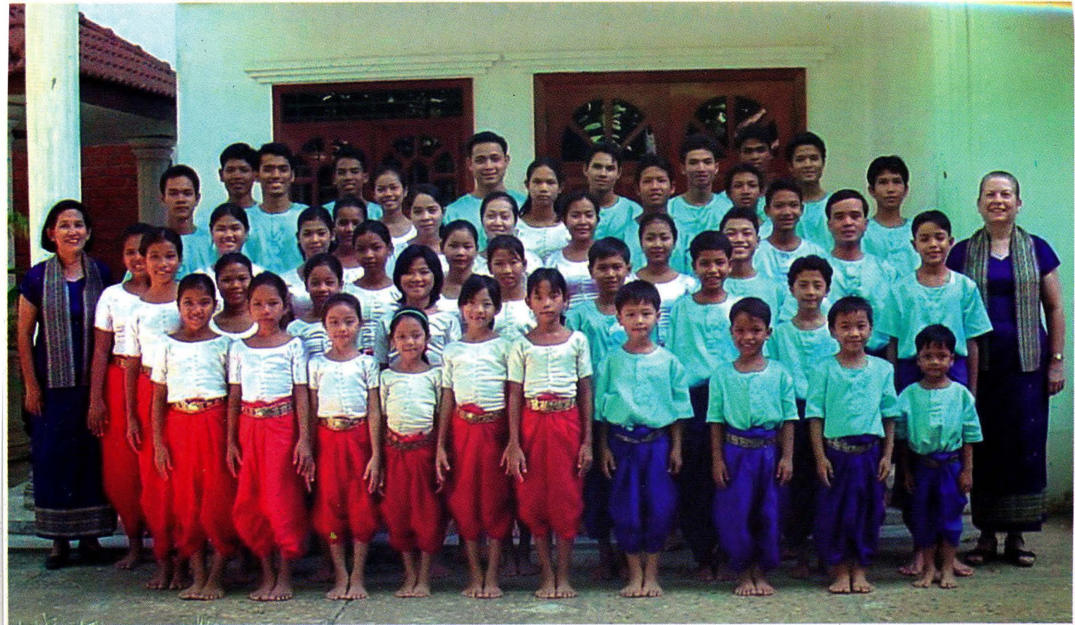
សាលាកិច្ចការសិល្បៈគ្រីស្ទានខ្មែរ